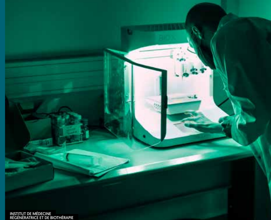
INSTITUT DE MÉDECINE RÉGÉNÉRATRICE ET DE BIOTHÉRAPIE