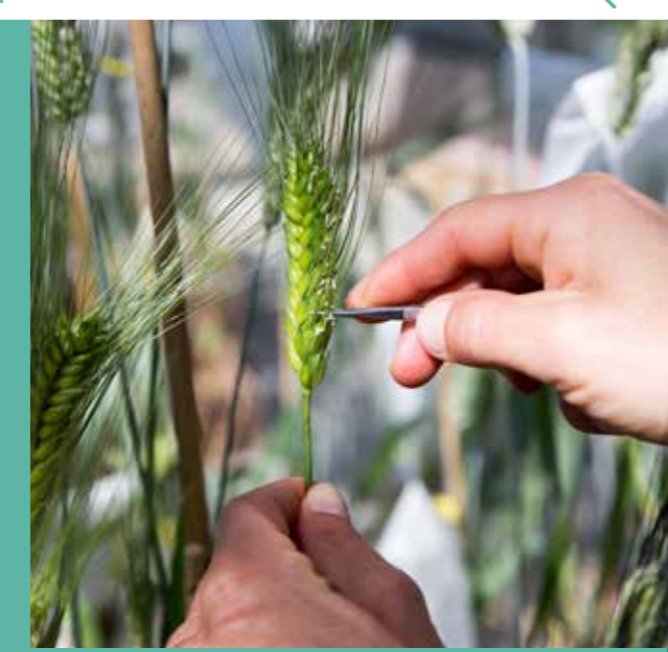
[1] Estimation Kompass 2019

60 entreprises agro-innovantes POUR 950 emplois