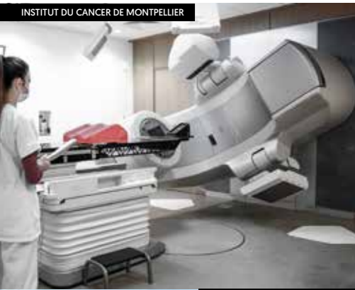
INSTITUT DU CANCER DE MONTPELLIER