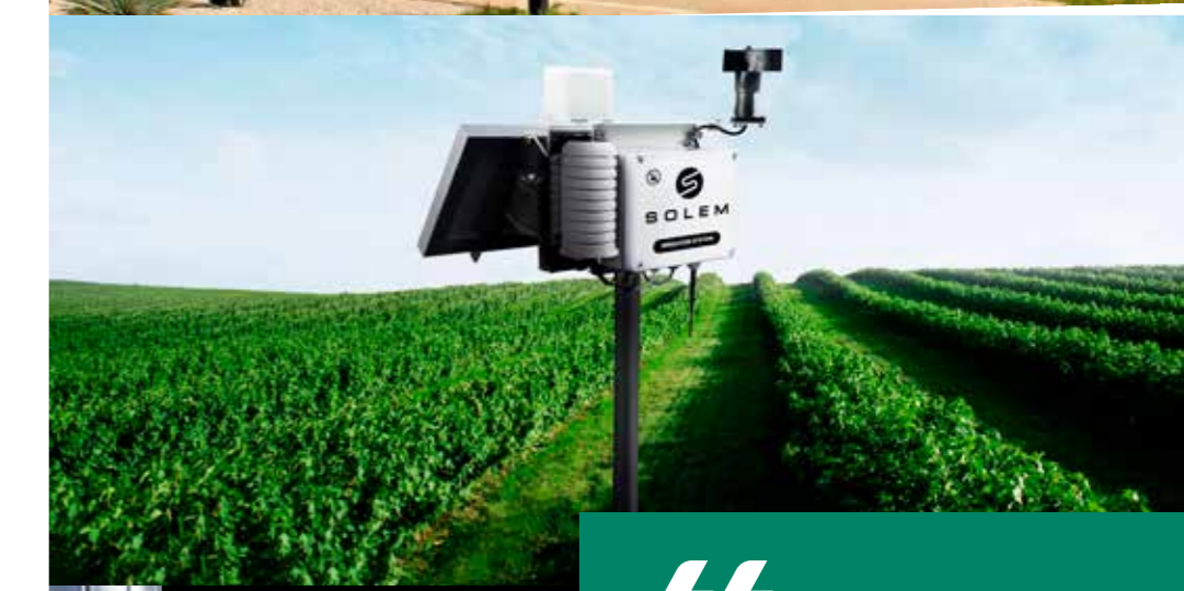
ARCAD - PREMIÈRE BANQUE DU MONDE VÉGÉTAL CULTIVÉ