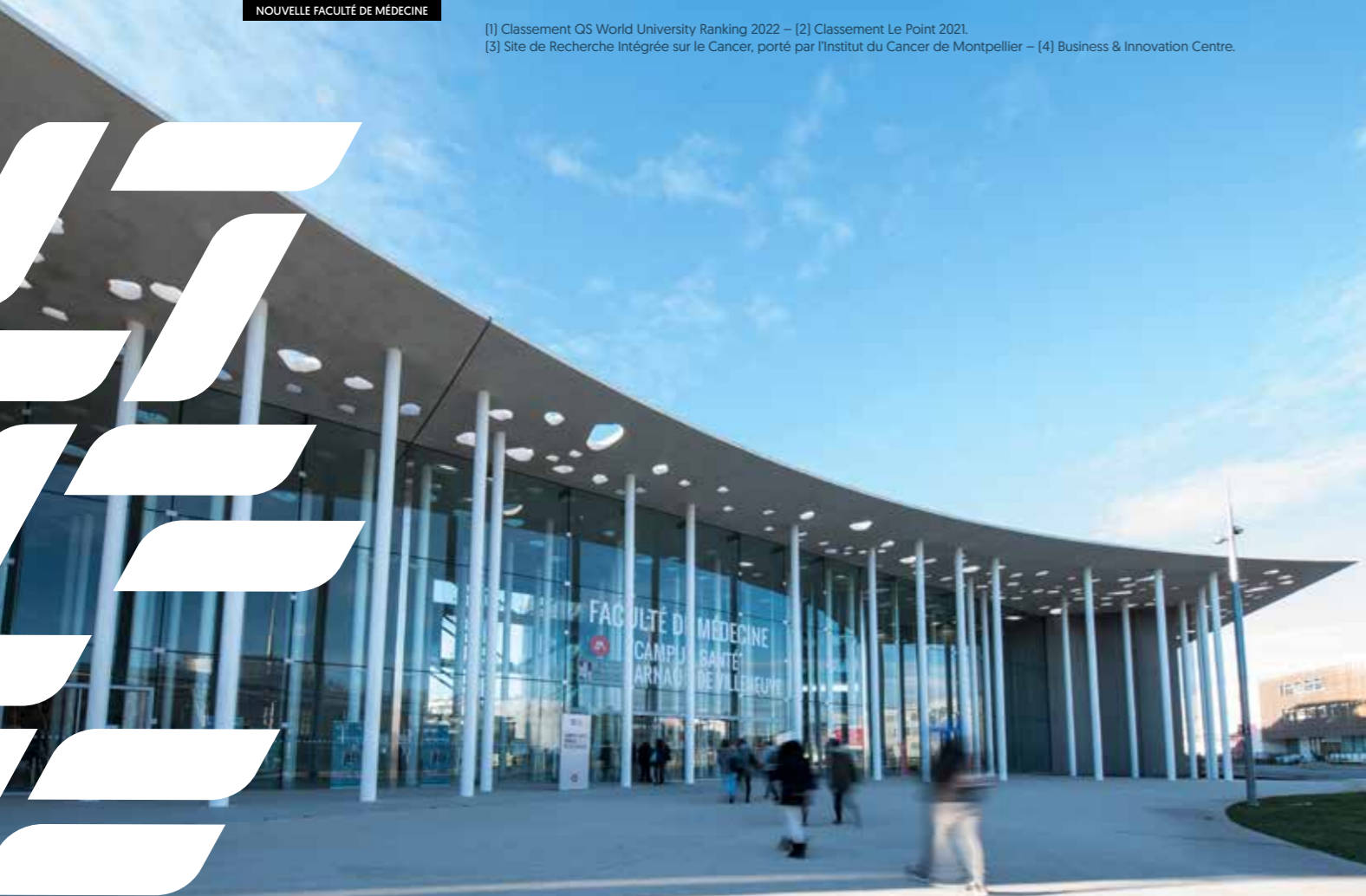
NOUVELLE FACULTÉ DE MÉDECINE