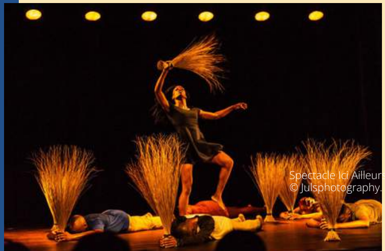
Spectacle Ici Ailleurs.