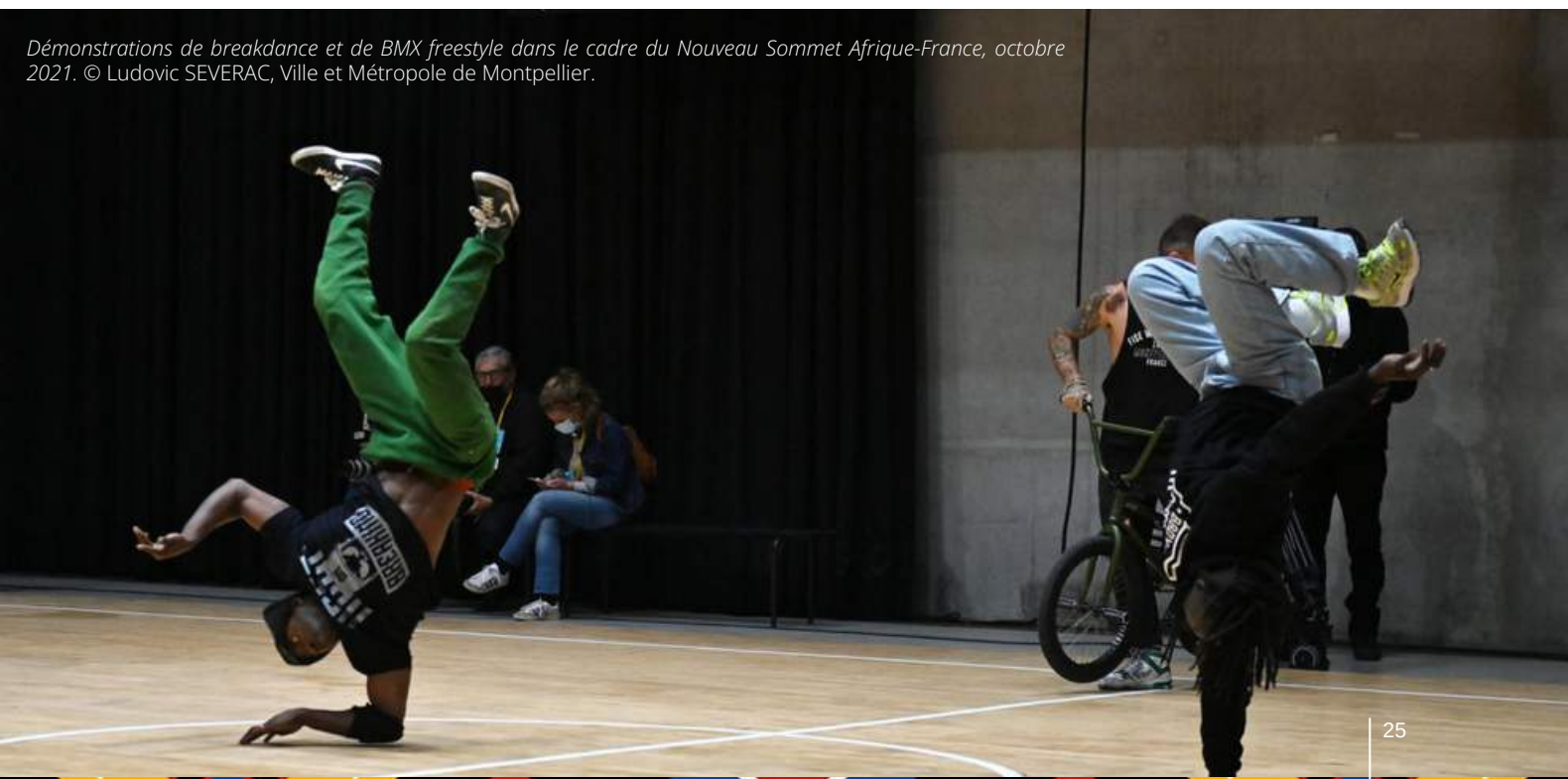
Démonstrations de breakdance et de BMX freestyle dans le cadre du Nouveau Sommet Afrique-France, octobre 2021.

Le programme complet de l'événement est consultable sur le site Internet de la Biennale Euro-Africa de Montpellier à l'adresse suivante : euro-africa.montpellier.fr