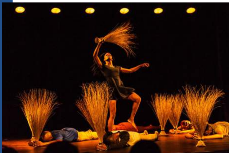
Spectacle Ici Ailleurs.